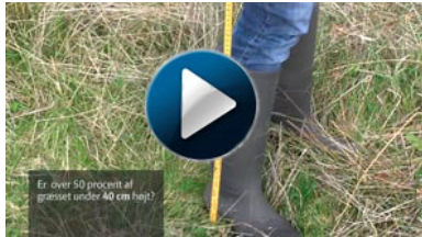
Tilskud til plejegræs: slæt