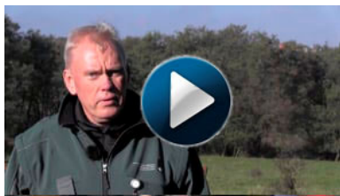
Tilskud til plejegræs: Fast græsningstryk