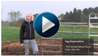
Tilskud til plejegræs: synligt afgræsset